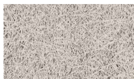
Heraklith [1.5 mm]